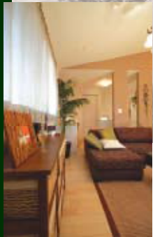
* LIVING ROOM *