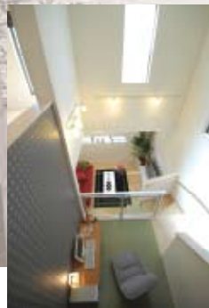
* MAT CORNER *