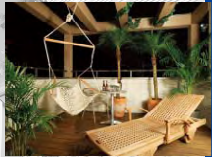
* TERRACE BALCONY *