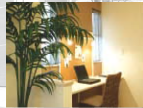
* FAMILY STUDY ROOM *