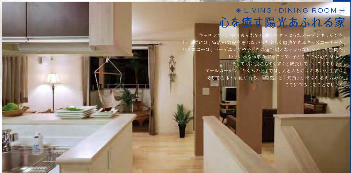
* LIVING・DINING ROOM *